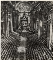
Esaki ta dos bista magifico di e inauguracion di e Concilio Ecumenico den e Basilica di San Pedro na Roma. Ribá e prome nos ta mira Papa Juan 23 rezando y pidiendo gracia di Dios pa e Concilio bira un carto y riba e di dos nos ta mira e impresionante interior di e Basilica, ora cu e Concilio Ecumenico a tumá su Asentonnan.